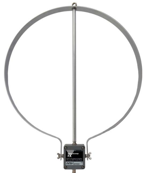
オプションとしてアルミ製フラットバーループ(直径約40cm)もございます。